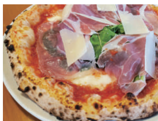
▶ マルゲリータ・生ハム・ルッコラ 1,944円