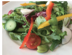
▶ グリーンサラダ 648円