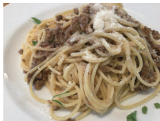
▶ ミートソース スパゲッティ 1,080円