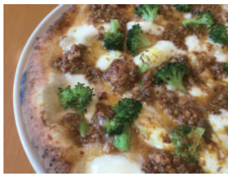
▶ インディアーナ 1,620円