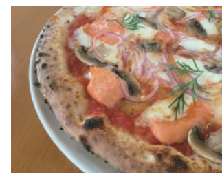
▶ サルモーネ 1,620円