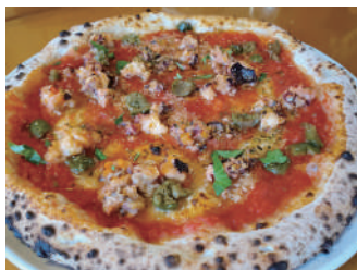
▶ サンタルチア 1,620円