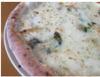
▶ クアットロ・フォルマッジ 1,512円