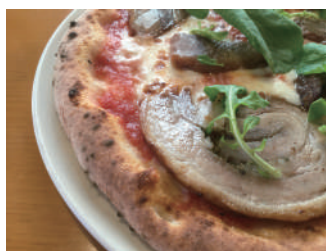
▶ ポルケッタ 1,836円