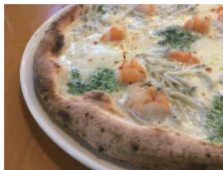
▶ アルモニア 1,620円