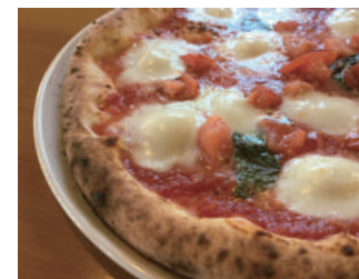
▶ マルゲリータ・エクストラ 1,944円