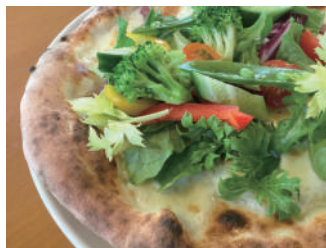
▶ ノティツィア 1,728円