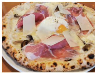
▶ ボスカイオーラ 1,836円