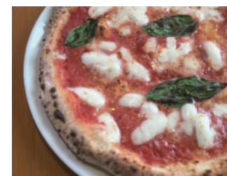
▶ マルゲリータ 1,188円