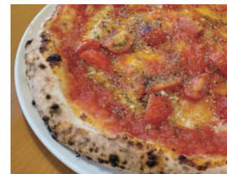
▶ マリナラ・エクストラ 1,188円