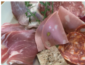
▶ 生ハム、パテ、 サラミの盛り合わせ 1,188円