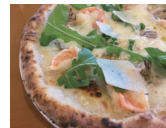
▶ カプリ 1,728円