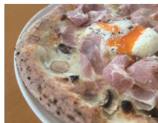
▶ カプリッチョーサ 1,620円