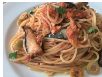
▶ ナスとツナのトマト スパゲッティ 1,080円