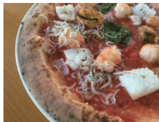
▶ マーレ 2,160円