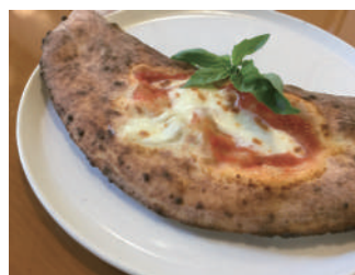
▶ カルツォーネ 1,620円