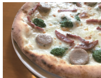
▶ ポパイの鉄の腕 1,620円