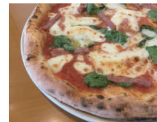
▶ ラザーニャ 1,620円