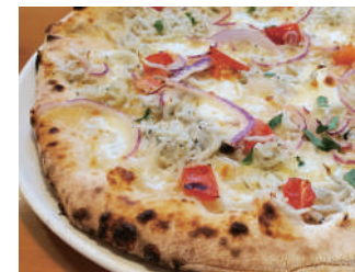
▶ チチェニエツリ 1,620円