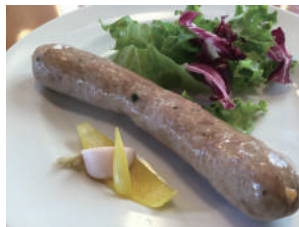
▶ 自家製の大きなソーセージ 1,188円